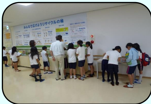
リサイクルの仕組み解説