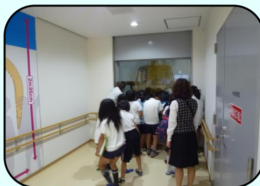
クレーン作業見学