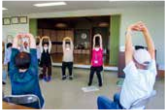
ふれあい・いきいきサロンで 健康教室