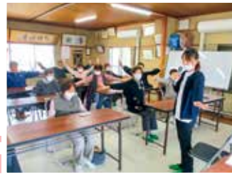
高齢者ふれあい会食会で 健康体操