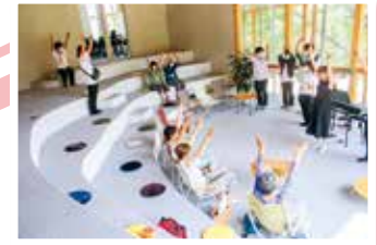
オレンジカフェこんぺいとう