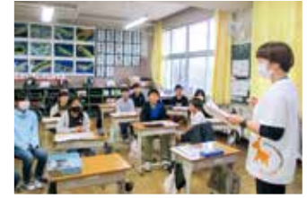
高齢者ふれあい会食会で 健康体操