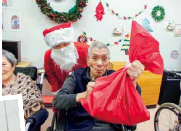
プレゼントありがとう～！