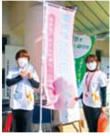
まちづくり協議会のイベントで 健康&介護相談