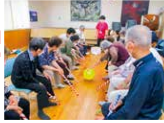
あんしん生活講座